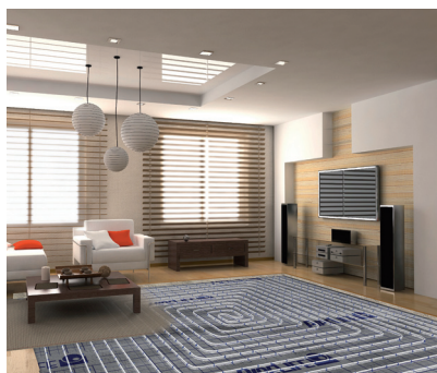
System RADOPRESS i FLOOR THERM